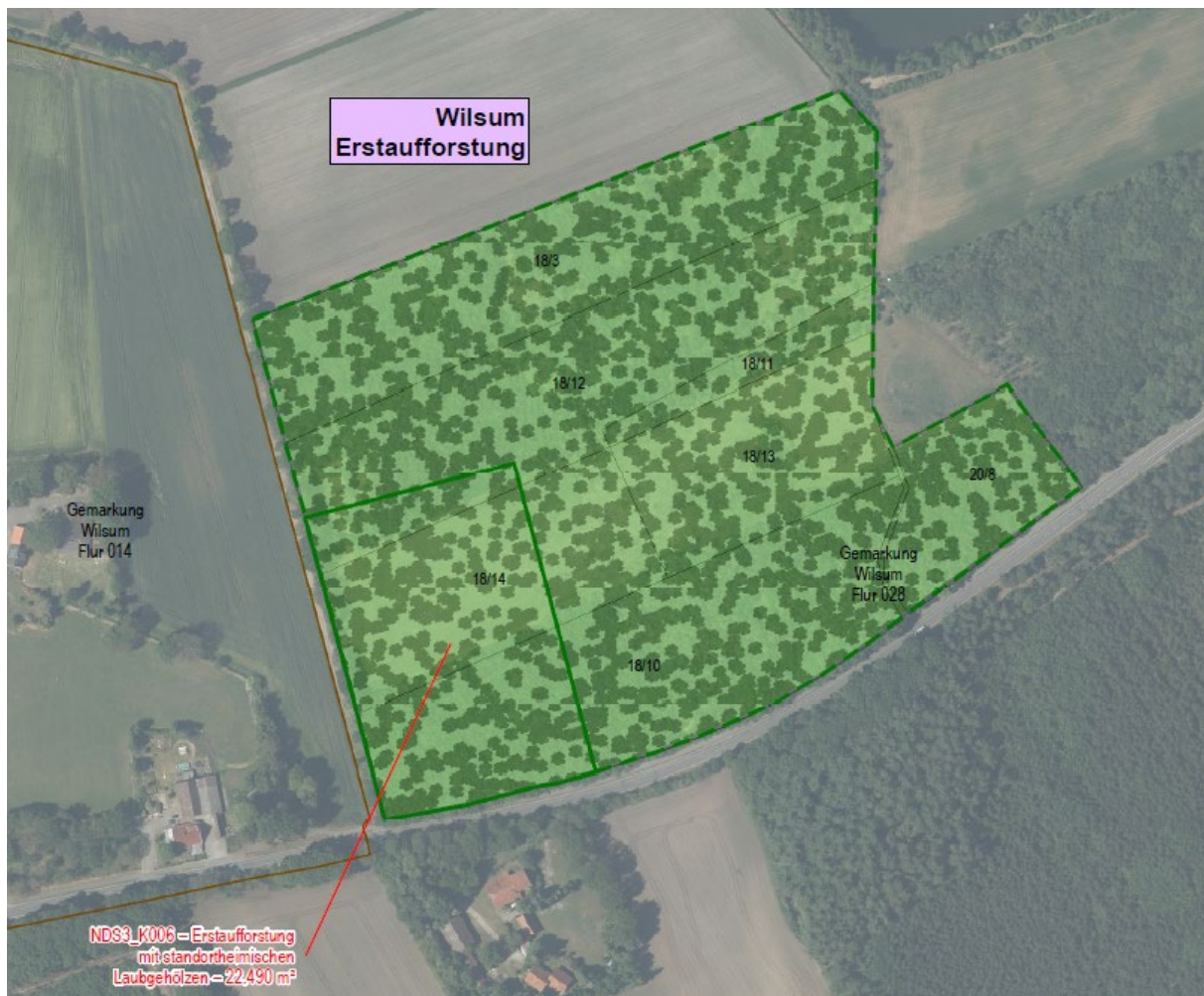
Abb. 1-1: Lageplan Erstaufforstung „Wilsum“

Die betroffenen Flurstücke sind zur Veranschaulichung in der nachfolgenden Abb. 1-1 abgebildet.